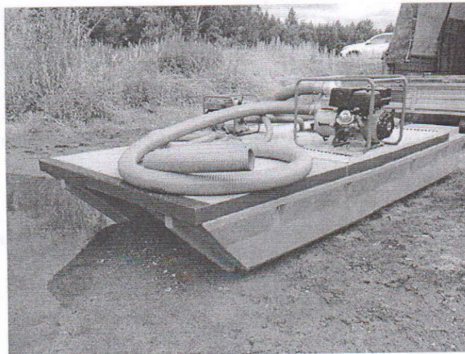
Фото: Мини земснаряда «МЧС-1800».

Мини земснаряд «МЧС-1800». Это многофункциональное устройство применяется для очистки водоема, углубления дна, откачки ила, намыва песчаного пляжа, добычи песчано-гравийных смесей. Изделие «МЧС-1800» способно откачивать даже сильнозагрязненную воду с твердыми частицами (до 25 мм).